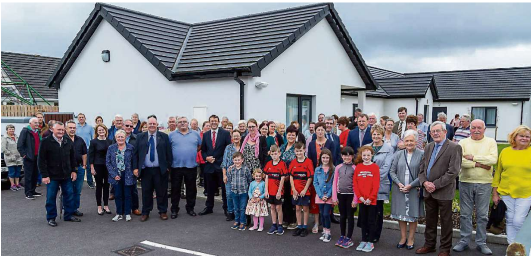
Aíonna i láthair ag oscailt oifigiúil na dtithe sóisialta ag Cuan Barra, Béal Átha 'n Ghaorthaidh.

Urraithe ag: Gael-Taca CORCAIGH LE GAELIS www.gael-taca.com 021-4310841